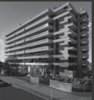
Edificio ARQ DOMUS