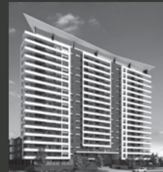
Edificio Mirador Parque los Reyes