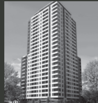
Edificio San Isidro