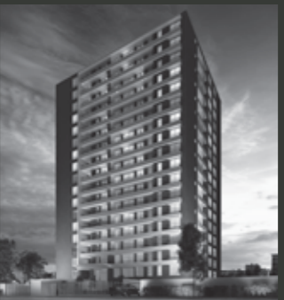
Edificio Urban UP