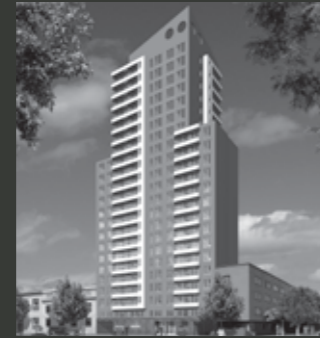
Edificio Centro Moneda