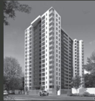
Edificio Armando Mook