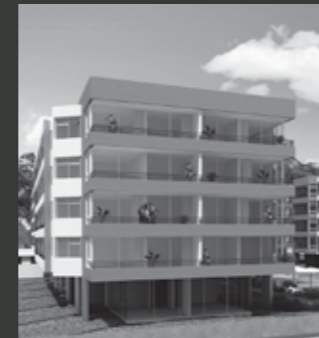
Edificio Bordemar Los Molles