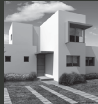
Condominio Jardín Oriente