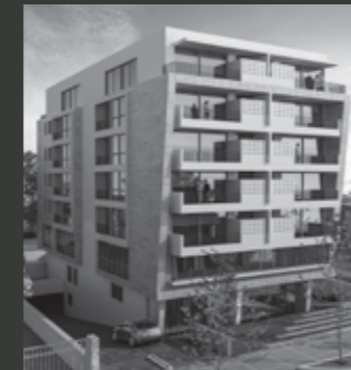
Edificio ARQ RODÓ