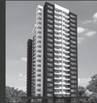
Edificio Cerro Amarillo