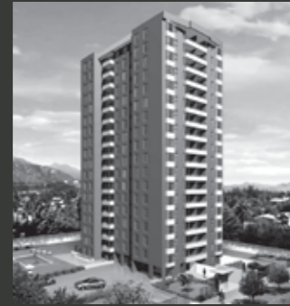
Edificio Centro Macul