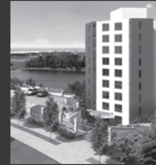
Edificio Puerto Andalú